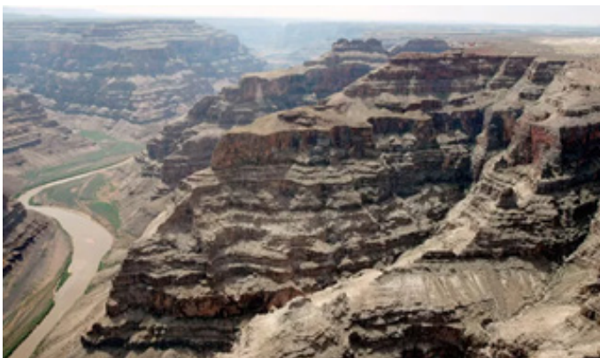
Vista aérea do Grand Canyon.

Observe a imagem e responda à questão 34.